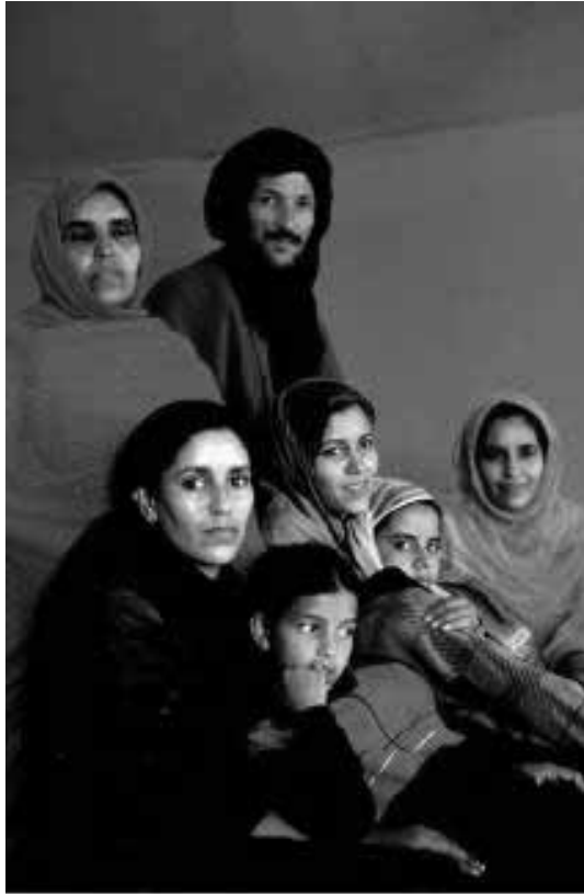
De oorsprong van het Saharaanse nationalisme